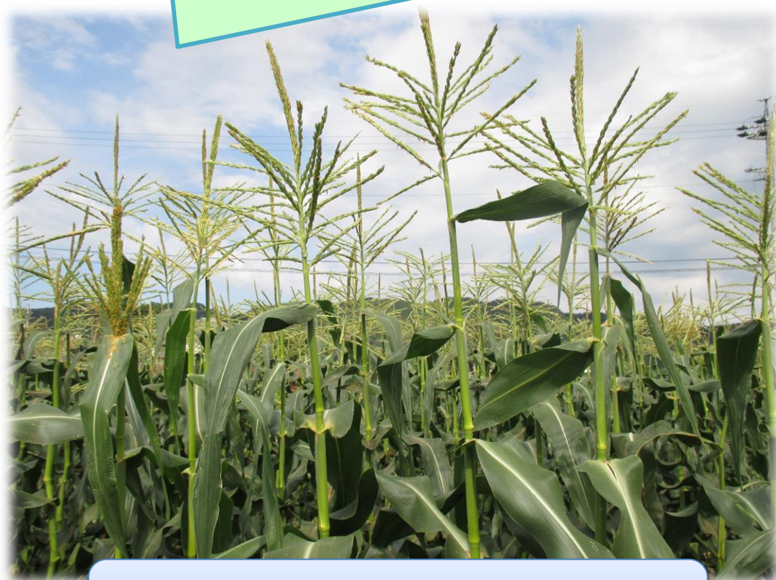
いけだまち 池田町のとうもろこし畑