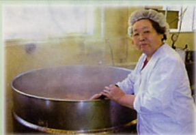
小池手造り農産加工所有限公司

複数の農業生産者で農産物を持ち寄り加工することでコラボ商品が生まれ、経済的負担の軽減・早期完売・多種多様なこだわり商品ができる