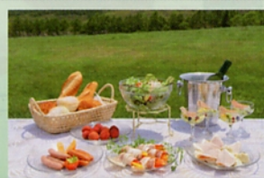
信州ハム株式会社