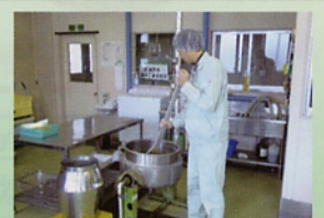
(社)長野県農村工業研究所

小ロットから委託、若しくは新商品開発相談ができる 県内の受託相談加工業者をご紹介します