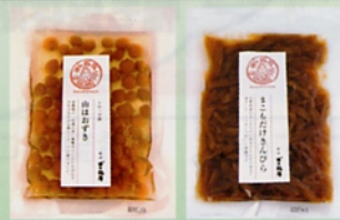
有限会社宮城商店