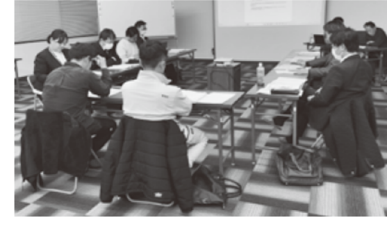
県青連北安曇支部勉強会

参加された青年部員の方からは積極的に質問が飛び出し、財務の観点から自社を見つめ直す良い機会となりました。商工会青年部では、こうし