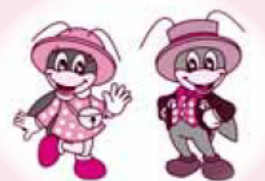
松川村マスコットキャラクター リンリン・りん太