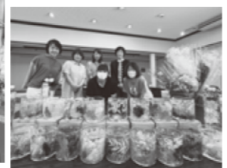
完成したハーバリウム

第8回 12/10 「フラワーアレンジメント講座」 フラワーショップ花野果さんをお迎えし、年末年始のアレンジを楽しく作成しました。 「北安曇支部 もちまわり研修会」10/5 大糸線を利用しようと南小谷駅から糸魚川駅間を