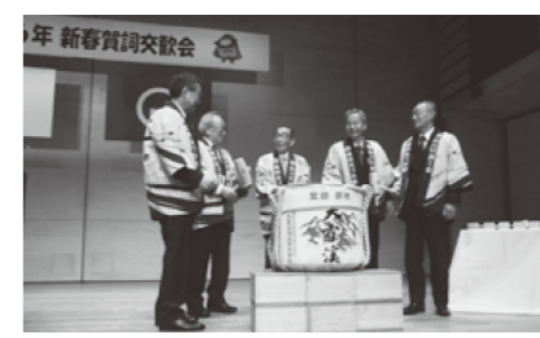
賀詞交歓会 鏡割り

開会にあたり内川商工会長から「県内産業はアフターコロナに移行したもののエネルギー価格や食料品等の一斉値