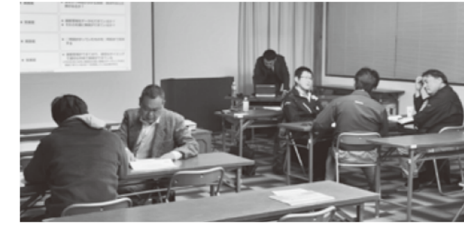
IT導入促進セミナー

ITをはじめとしたツールの導入はあくまで手段であり、その先にある解決したい課題や理想の状態を認識・設定することが必要であるとのことでした。