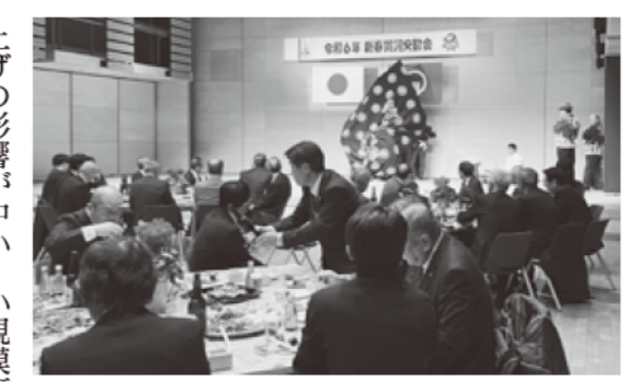
飲談の合間に獅子舞の披露

だいた後、恒例となっている鏡割り・乾杯が行われ歓談に入りました。合間には、細野共愛社の皆さんによる獅子舞