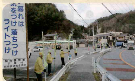
「年末の交通安全運動」で、管内の国道において街頭啓発活動を実施した。(阿南)