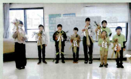
「年末の交通安全運動」で、少年部による交通安全を祈願した「正月飾り作成研修会」を開催した。(安曇野)