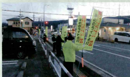
「年末の交通安全運動」で、市役所西県道交差点において街頭啓発活動を実施した。(茅野)