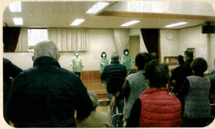
管内の公民館において高齢者に対する交通安全教室を開催した。(小諸)