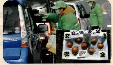
「年末の交通安全運動」で、ドライバーに「交通安全文字入りりんご」を手渡して交通事故防止を指導した。(川西)