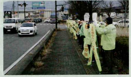
「年末の交通安全運動」の活動で、松代大橋前県道において街頭啓発活動を実施した。(長野南・松代)