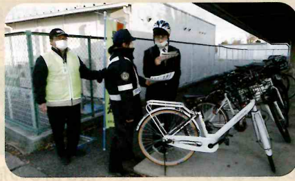
「年末の交通安全運動」の活動で、管内の高校において自転車ヘルメットの着用啓発を実施した。(須高)