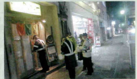
「年末の交通安全運動」で、飲食店を対象とした「飲酒運転防止パトロール」を実施した。(飯伊)