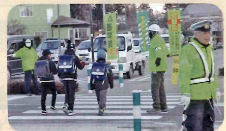
「年末の交通安全運動」で、通学路において児童に対する見守り活動を実施した。(池田松川)