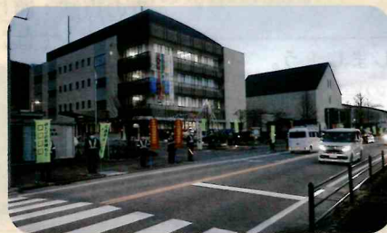
「年末の交通安全運動」で、諏訪警察署前において街頭啓発活動を実施した。(諏訪)