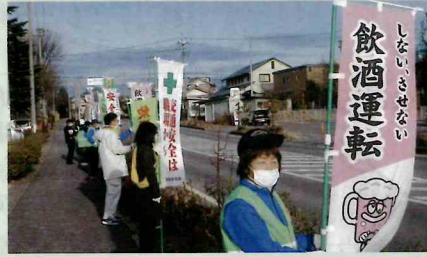
「年末の交通安全運動」で、御代田町内の県道において飲酒運転防止などと呼び掛けた。(佐久)